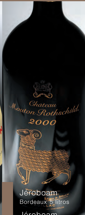
Jéroboam Bordeaux 5 litros Jéroboam Outras regiões 3 litros