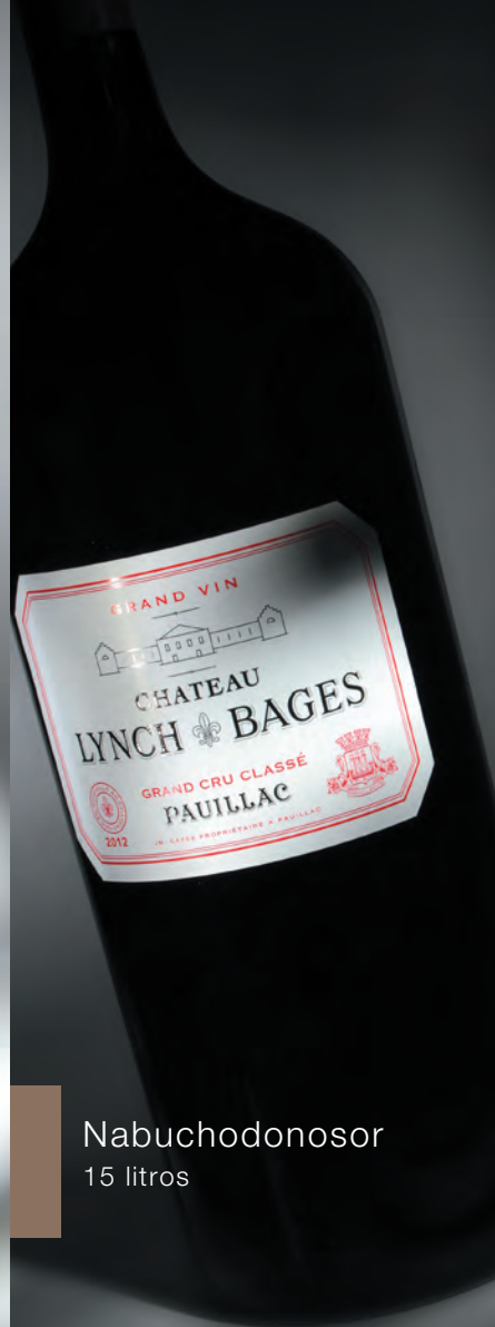
Nabuchodonosor 15 litros