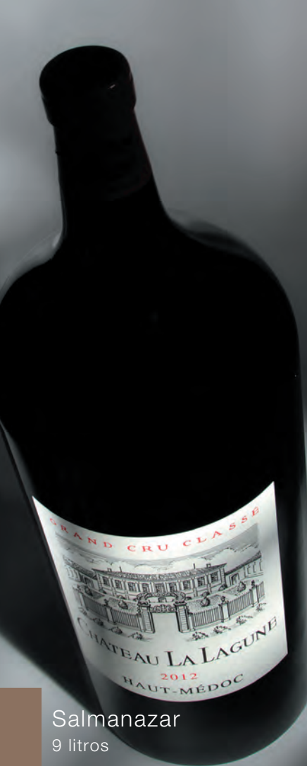
Salmanazar 9 litros