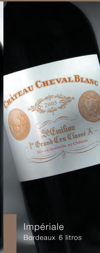
Impériale Bordeaux 6 litros