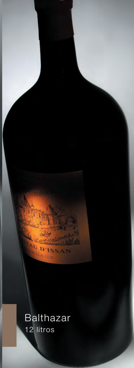
Balthazar 12 litros