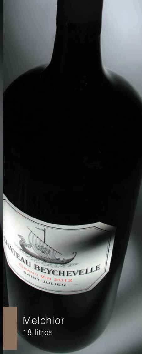
Melchior 18 litros