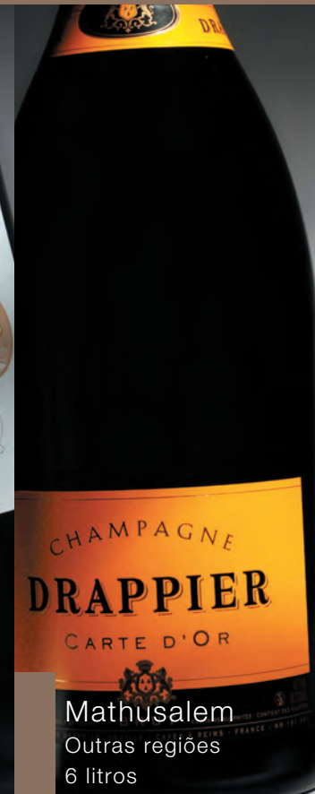
Mathusalem Outras regiões 6 litros