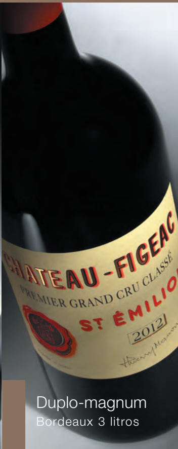
Duplo-magnum Bordeaux 3 litros