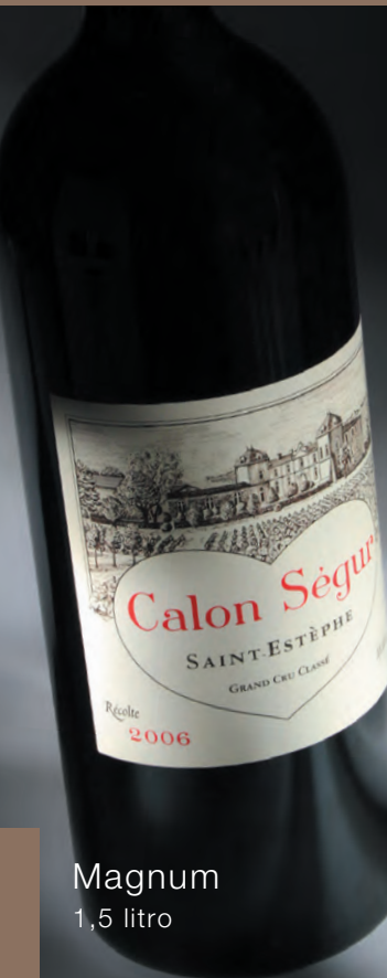
Magnum 1,5 litro

Descubra os nossos grandes formatos de Bordeaux, Champagne, Bourgogne, Vallée du Rhône, Provence, Alsace, Toscane, Piemont... no site www.millesima.pt